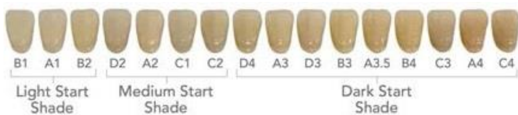
Gambar 1. Urutan VITA shade guide berdasarkan perubahan warna

Pengujian aktivitas pemutih gigi dilakukan secara in vitro dengan menggunakan gigi asli yang didapatkan dari praktek dokter gigi. Gigi yang digunakan memiliki syarat bersih dari plak dan bakteri. Gigi direndam 5 menit 2 kali setiap hari hingga dua bulan untuk kemudian diamati perubahan warnanya menggunakan metode kolorimetri. Kondisi ini disesuaikan proses bleaching secara klinis. Gambar 1 menunjukkan skala pemutihan gigi menggunakan VITA shade guide sebagai dental colorimetric kit dengan urutan warna dari terang ke gelap.